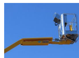
Fly jib (option)