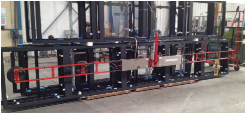
DSKE2 format XXL